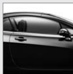
Piezas de carrocería