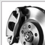
Sistema de frenado